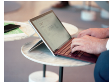
eLearning Elemente Vielfältige Lernmaterialien online verfügbar