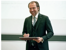
Vorlesungsaufzeichnung Präsenzveranstaltung der Module jederzeit ansehen

Zugeschnitten auf berufstätige Studierende und je nach Kurs als Blended Learning, Präsenzveranstaltung oder Game-based Learning konzipiert. Das Blended- und Distance Learning Konzept beinhaltet folgende Bausteine: